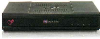
1530 / 1550