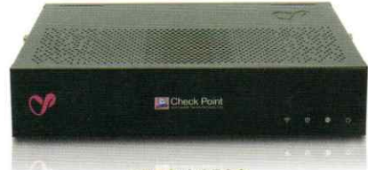
1570 / 1590